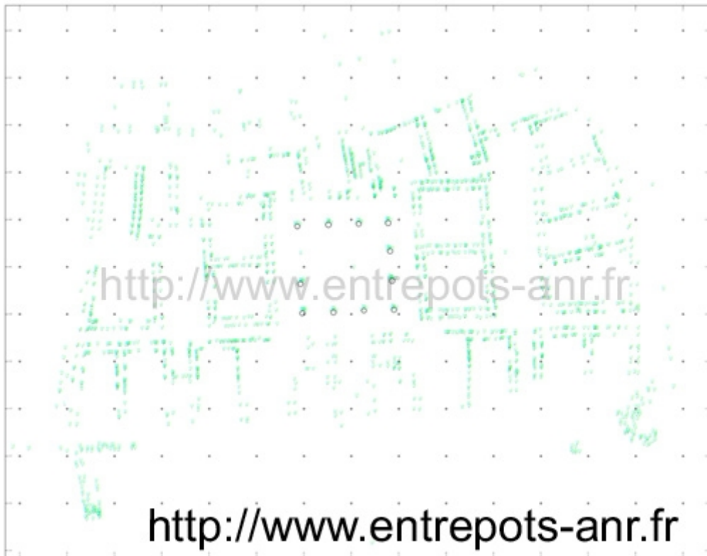
Fig. 1: Plan topographique du Magasin des colonnes échelle 1/250° (EFA-ANR /L. Fadin)