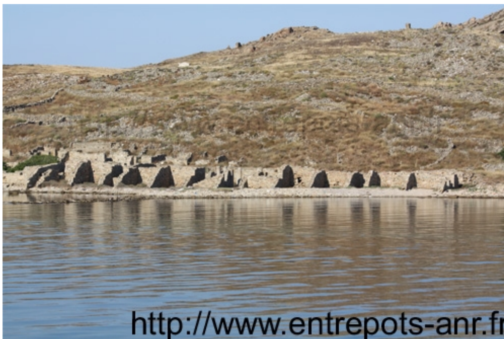
Fig. 2: La façade Ouest du Magasin des colonnes.

Les observations réalisées renforcent la conviction qu'il s'agit bien d'édifices commerciaux ayant eu plusieurs fonctions. La façade devait être consacrée au commerce de transit, puisque toutes les pièces étaient équipées avec des mezzanines ou des meubles et donnaient directement sur les quais. L'intérieur est plus complexe, organisé autour de cours qui